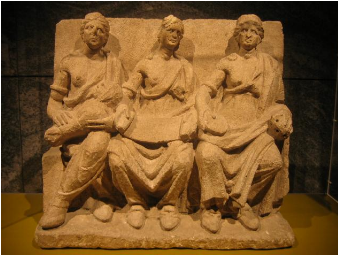
Trio di dee nutrici da Vertault (Côte'd'Or). Museo di Châtillon-sur-Seine (da N.Beck, p. 74)