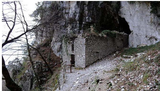
Grotta Lattaia e chiesa rupestre di Sant'Angelo, Morolo (FR)