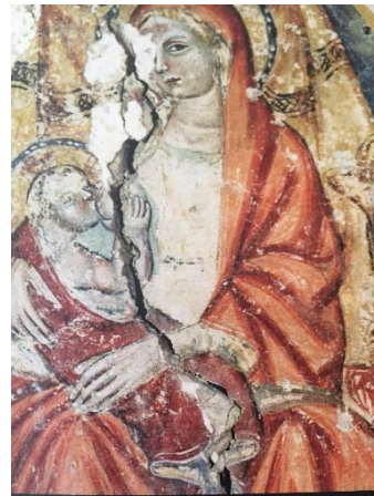
Madonne del Latte dalla cripta della chiesa di S. Luca a Maranola di Formia